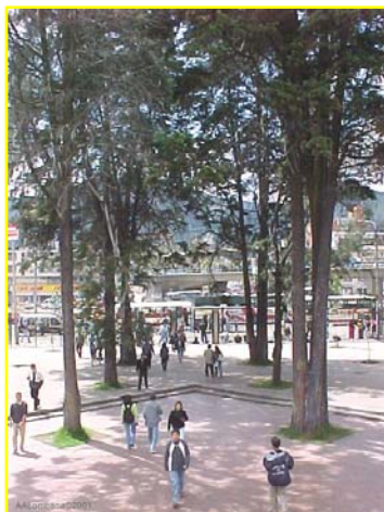
Vista de la entrada por la carrera 30 de la Universidad Nacional