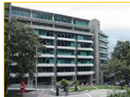
Edificio Fernando Barón, Pontificia Universidad Javeriana